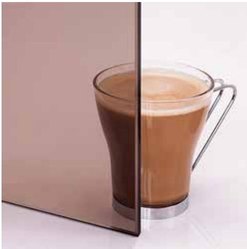
Bronze Bronze Bronze Pronks Бронза