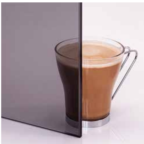
Grau Grey Gris Hall Серое