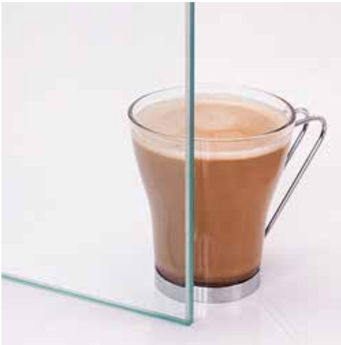
Klar Clear Clair Kirkas Прозрачное